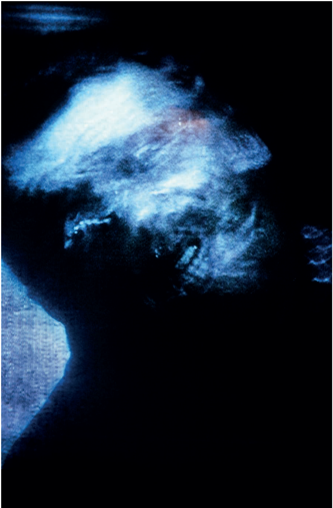
Christian Rickert | Nachtmahr, 1993, Cibachrome hinter Plexiglas, 59 x 40 cm