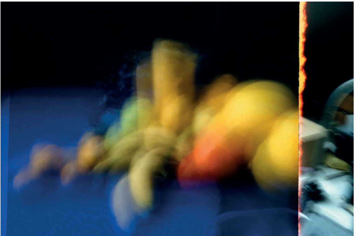
Christian Rickert | Stilleben-Collage warm-kalt, Okt. 1995, Cibachrome hinter Plexiglas, 60 x 90 cm

Vernissage: 24. Januar 2019 | 19–22 h 25.01.–08.03.2019