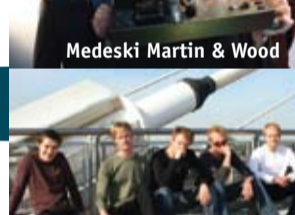
Medeski Martin & Wood

John Medeski – Konzertflügel, Wurlitzer, Moog-Synthesizer, Hammondorgel, Clavinet Hohner D6 Billy Martin – Schlagzeug, Perkussion • Chris Wood – E-Bass Vorsicht, Grooveattacke!