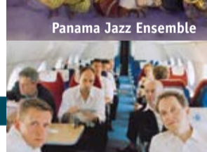
Panama Jazz Ensemble