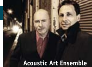
Acoustic Art Ensemble